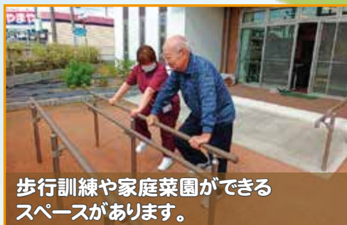
歩行訓練や家庭菜園ができる スペースがあります。