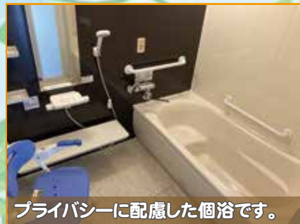
プライバシーに配慮した個浴です。