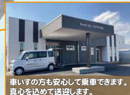
車いすの方も安心して乗車できます。 真心を込めて送迎します。