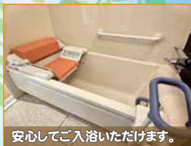
安心してご入浴いただけます。