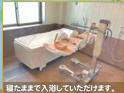
寝たままでも入浴していただけます。

グッデイ足利では、栄養バランスがとれた美味しいお食事と、バリエーション豊富なレクリエーションをお楽しみいただけます。 お風呂は常に清潔を保ち、スタッフが丁寧に対応させていただきます。