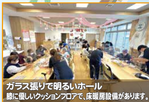
ガラス張りで明るいホール 膝に優しいクッションフロアで、床暖房設備があります。