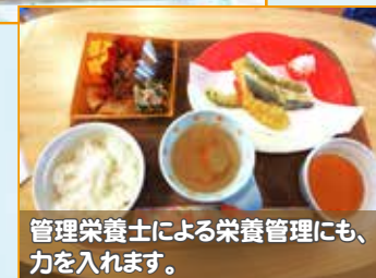
管理栄養士による栄養管理にも、 力を入れます。