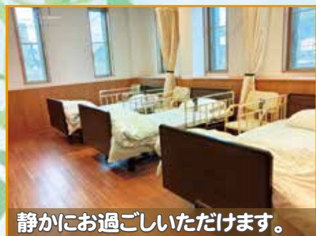
静かにお過ごしいただけます。