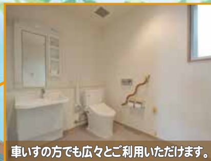
車いすの方でも広々ご利用いただけます。